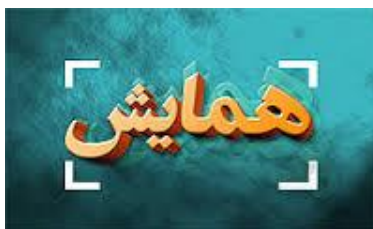
شکل (۱): نمونه شکل

هر شکل باید دارای شماره و عنوان (توضیح) باشد که به صورت وسط چین در زیر آن با قلم نازنین پرنرنگ و اندازه ۱۰ PT تایپ و به ترتیب از ۱ در داخل پرانتز شمارهگذاری میشود. شکلها در داخل متن و در جایی که به آنها ارجاع میشود، درج گردند. ذکر واحد کمیتها در شکلها الزامی است. در متن مقاله به همه شکلها ارجاع شود. هر شکل را با یک سطر خالی فاصله از متن ماقبل و مابعد آن قرار دهید (توجه شود که خود شکلها و نمودارها نیز، همانند جدولها باید در موقعیت وسط چین نسبت به طرفین کاغذ قرار گیرند).